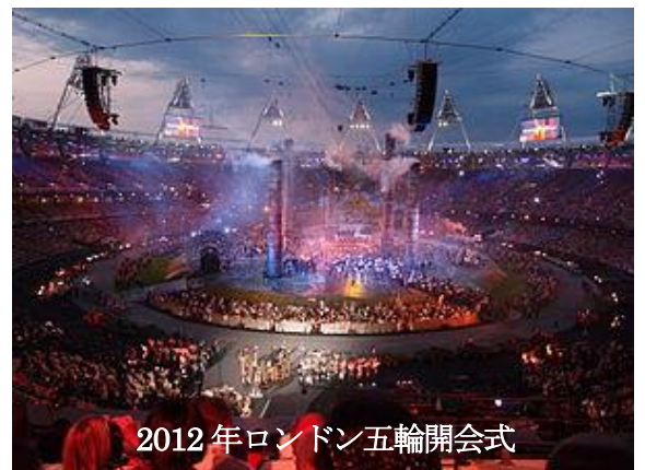
2012年ロンドン五輪開会式

204の国と地域・参加選手数、約1万5千人で26競技、302種目を競います。これまでイスラム教の戒律に基づき男性しか出場させていなかったサウジアラビア・カタール・ブルネイが女性選手を派遣する事になりました。 オリンピック史上初めて全ての国と地域から女性選手が参加できる大会 となり、又この大会はボクシングで女子種目を新たに採用し、 初めて全競技で男女の種目が実施される ことになりました。