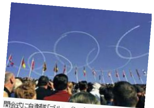
開会式に自衛隊「ブルーインパルス」が空に描いた五つの輪 1964年10月10日 東京・国立競技場